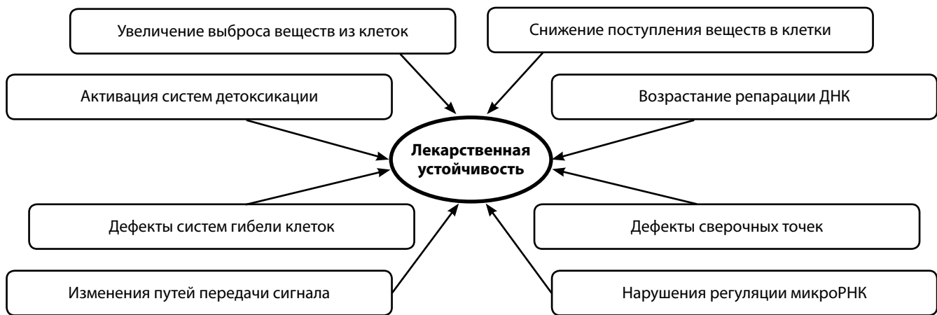
Рис. 1. Механизмы лекарственной устойчивости опухолевых клеток

стать устойчивыми к большому количеству веществ, разных по механизму действия и структуре. Среди этих веществ химиопрепараты, используемые при терапии рака молочной железы (РМЖ), – доксорубин, даунорубин, винбластин, паклитаксел [4]. Причиной резистентности к цисплатину может являться пониженное энергозависимое поступление препарата в клетки [5]. Резистентность к химиопрепаратам может быть связана с функционированием систем детоксикации, в частности с системой многоцелевых оксидаз P450 [6], а также с системами репарации ДНК [7]. Важным механизмом лекарственной устойчивости являются нарушения программ гибели клеток, например апоптоза [8]. Нарушения функционирования сигнальных путей клетки, вовлеченных в контроль ее пролиферации и выживания, также могут служить механизмом лекарственной устойчивости [9]. В последние годы появились данные о важной роли микроРНК в прогрессии и лекарственной устойчивости РМЖ [10]. Сочетания разных механизмов лекарственной устойчивости нередко обнаруживаются в клетках РМЖ. Лекарственная устойчивость опухолевых клеток тесно связана с основными признаками злокачественной трансформации [11], что еще раз подчеркивает сложность этой проблемы. В данной статье мы разберем подробнее новые данные, относящиеся к некоторым механизмам лекарственной устойчивости РМЖ, как предсуществующей, так и приобретенной в результате лечения.